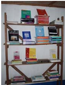
1 er arrivage de livres

Autre groupe issu des mouvements de jeunesse de La Hulpe, URAFIKI asbl est également actif dans le partenariat avec Kasongo et centre principalement son action sur l'éducation en soutenant des initiatives locales : création d'une bibliothèque de livres scolaires (livres récoltés à La Hulpe), à usage des enseignants ; assistance à la radio locale « la Voix des Paysans » dont l'importance est primordiale, car c'est l'unique source d'information locale pour la population ; ... tout récemment (février 2007) la bibliothèque a reçu une photocopieuse offerte grâce à un subside de la commune de La Hulpe. Une nouvelle action est à l'étude pour favoriser la scolarisation d'enfants sans ressources.