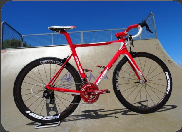
NEREH 1099,00€* EOLUS