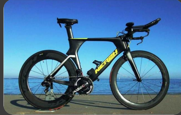
NEREH 1830,00€* DAEMM