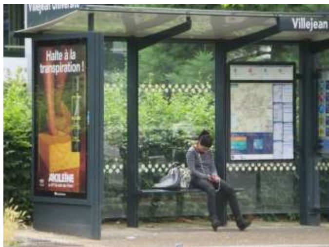
Mademoiselle, c'est l'été ! Il fait un temps à mettre des tongs !