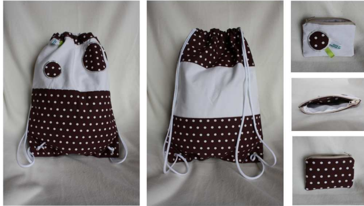
Ainsi font Mes Petites Marionnettes

Pour un chouette sac à dos déjà vu ici: www.mesmarionnettes.canalblog.com