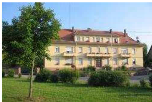
La gendarmerie a trouvé son nouveau terrain.

A l'ordre du jour du conseil municipal, réuni mardi soir: la vente du terrain situé près de l'atelier communal à la Sibar ainsi que la maîtrise d'ouvrage de la construction de la nouvelle gendarmerie.