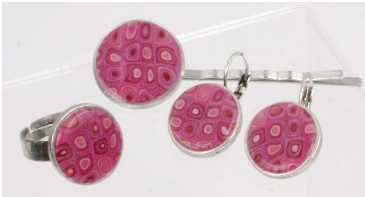
Ensemble Barrette, Bague et Boucles d'oreille (petit modèle)

5) Il ne reste qu'à passer au four (avec l'apprêt), pendant 30 minutes à 110°