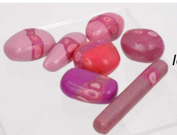
Idées de perles avec les reste de la cane