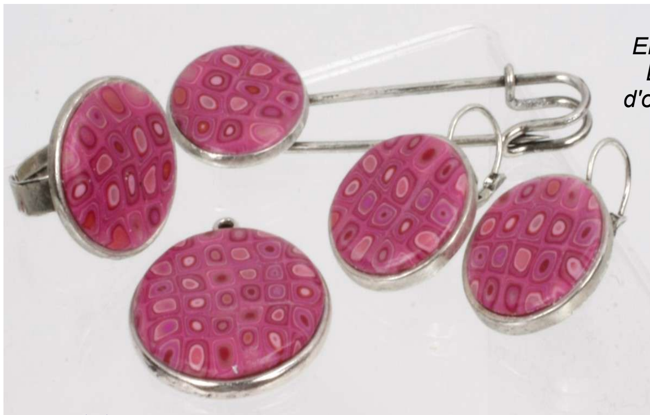
Ensemble Broche, Bague, Boucles d'oreille et pendentif

Déjà présenté par d'autres comme Parole de pâte ou Mathilde Colas, ce Tuto n'en est pas moins l'un des essentiels pour tout ceux qui utilisent le Clay-Gun dont les résultats spectaculaires sont obtenus rapidement.