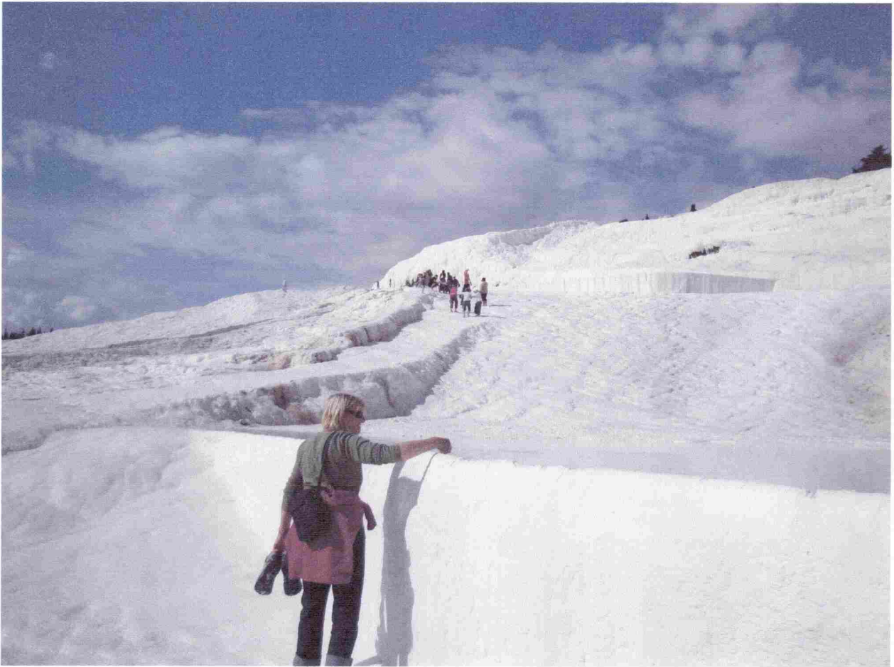
Pamukkale, le château de coton, l'eau à 37°.